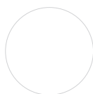
KORPUS Weiß Matt

Metallleiste zur Verschraubung der Arbeitsplatte