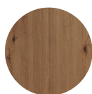
KORPUS Artisan Eiche Nachbildung

Metallleiste zur Verschraubung der Arbeitsplatte