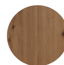
FRONT Artisan Eiche Nachbildung