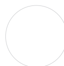
FRONT Weiß Hochglanz