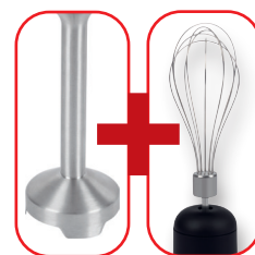
Edelstahl-Mixstab + Edelstahl-Schneebeesen