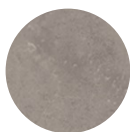
ARBEITSPLATTE Beton Optik